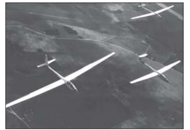
Skrydyje dvi „Lietuvos“ ir „Nida“. 1983 m.

Prieniškiai į gamyklą iš įvairių Lietuvos kampelių suvažiavusius jaunuolius greitai praminė „sklandukais“. Jie ne tik dirbo neskaičiuodami valandų, laisvalaikiu skraidė sklandytuvais, lėktuvais, bet ir gerokai praturtino Prienų miesto kultūrinį gyvenimą. Pirmieji „Trapuko“ šokėjai buvo „sklandukai“, pučiamųjų orkestro muzikantai – taip pat „sklandukai“. Jie miesto garbę gynė