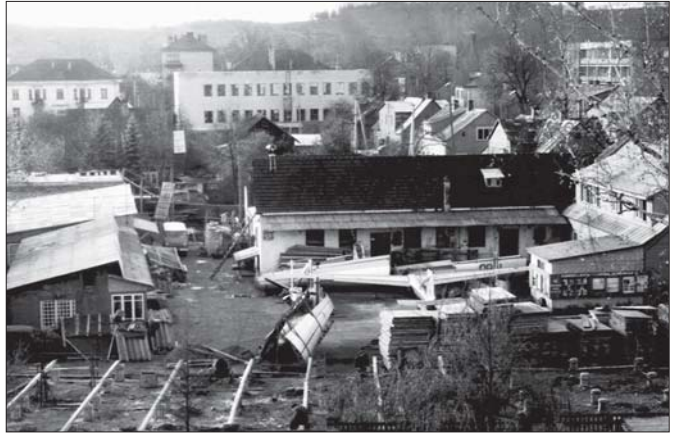
ESAG 1975 m.