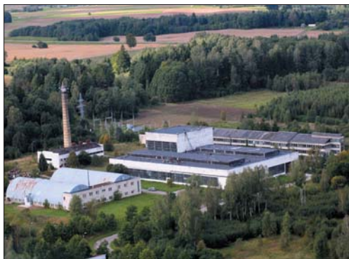
UAB „Sportinė aviacija ir Ko“ gamykla 2012 m.