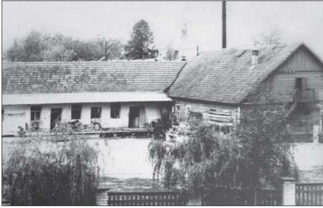
1969 m. Prienų senojoje pieninėje pradėjo kurtis Eksperimentinės sportinės aviacijos dirbtuvės.