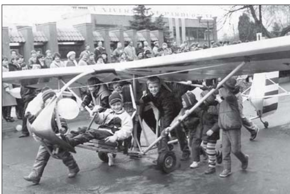
Jaunieji sklandytojai Prienų miesto šventinėje demonstracijoje, 1986 m.