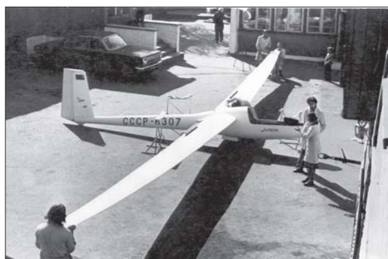
ESAG kieme, 1975 m.