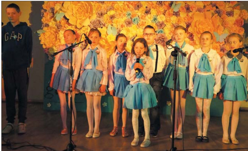
Naujosios Ūtos pagrindinės mokyklos mokinių ansamblis.